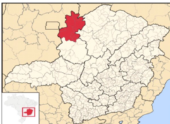
Figura 2. Microrregião de Unaí.

Referente à taxa de crescimento populacional, na região Noroeste de Minas a população aumentou de 305.285 habitantes para 334.509, num total de crescimento de 9,6%.